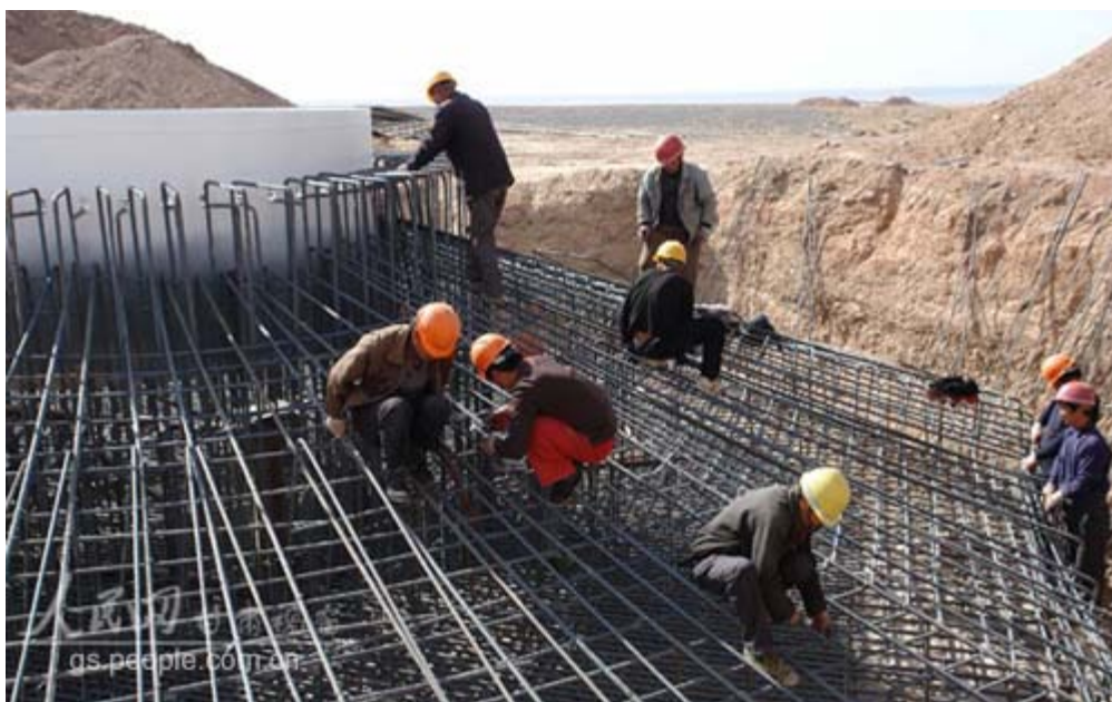
风机基坑施工工地

酒泉市瓜州县龙源 30 万千瓦风电项目是国家发改委在瓜州县确定的国产自主化示范风电场，该项目由中国龙源电力集团投资 24.98 亿元建设，拟安装拥有自主知识产权的国产 1500kw 风机 198 台。