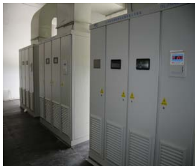
2.3MW 风电发电机组控制系统及变流器检测平台