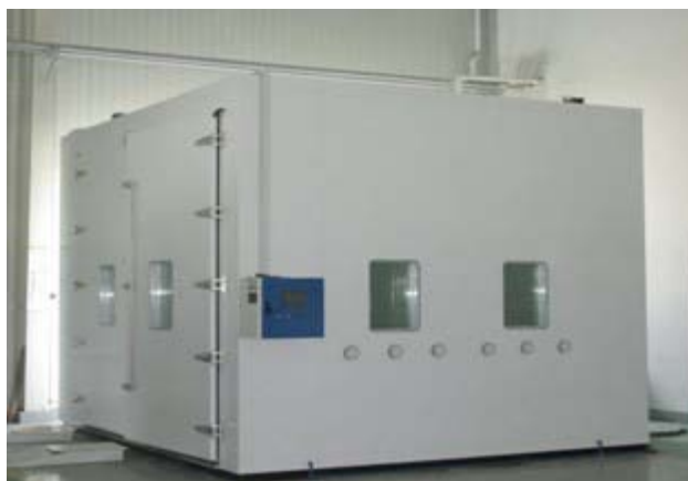
大型步入式高低温湿热实验室

该检测平台能针对在地面上 2.3MW 以下风力发电机组进行各种型式试验的功率试验平台，该检测平台要求能够达到风力发电机组的额定功率输出。同时具备扩容的功能,最大容量能扩大到 3.5MW,可以检测 3.5MW 以下的控制系统及变流器。