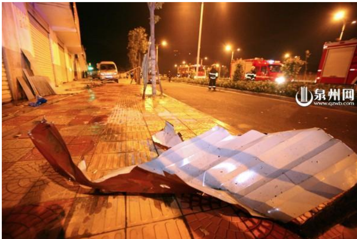
爆炸冲击波巨大，将整个厂房的天棚及附近的玻璃震裂。