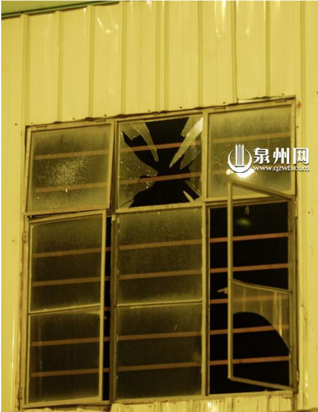
爆炸冲击波巨大，将整个厂房的天棚及附近的玻璃震裂。