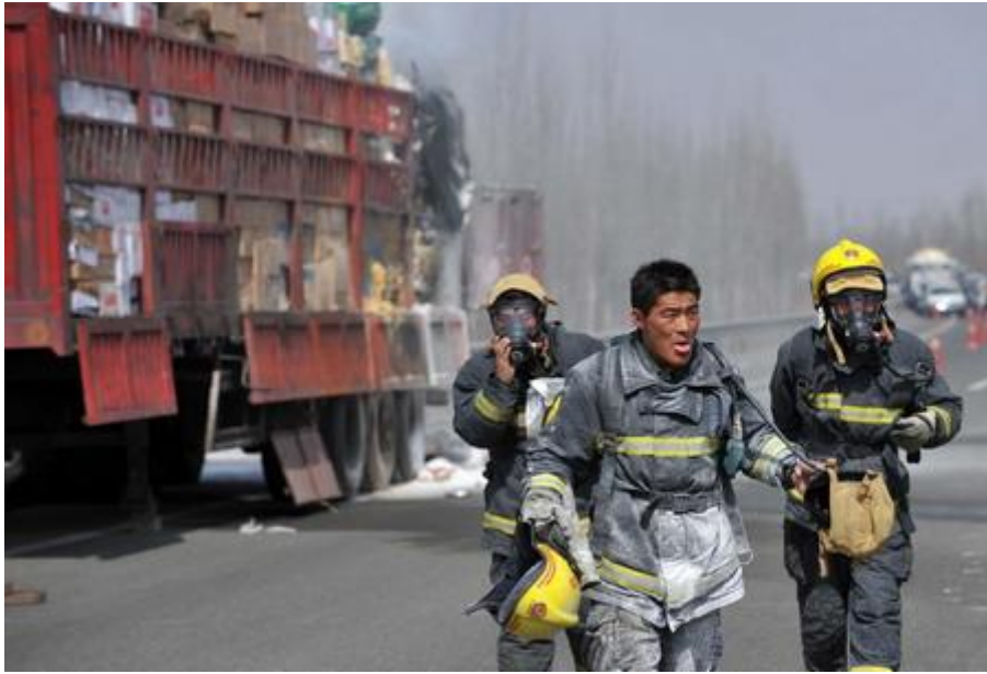
3月26日，消防队员在现场处理火情。