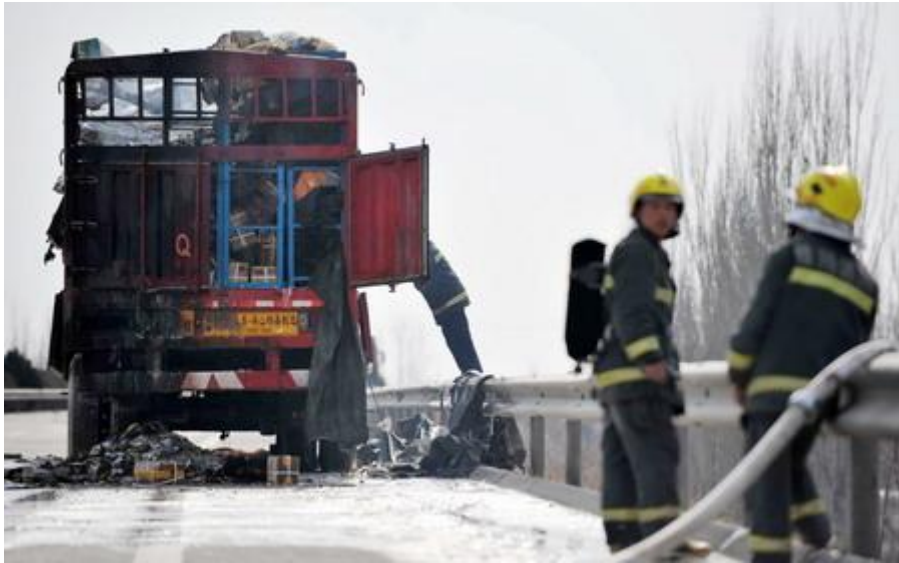
3月26日，火情基本被控制后，消防队员在查看起火车辆情况。