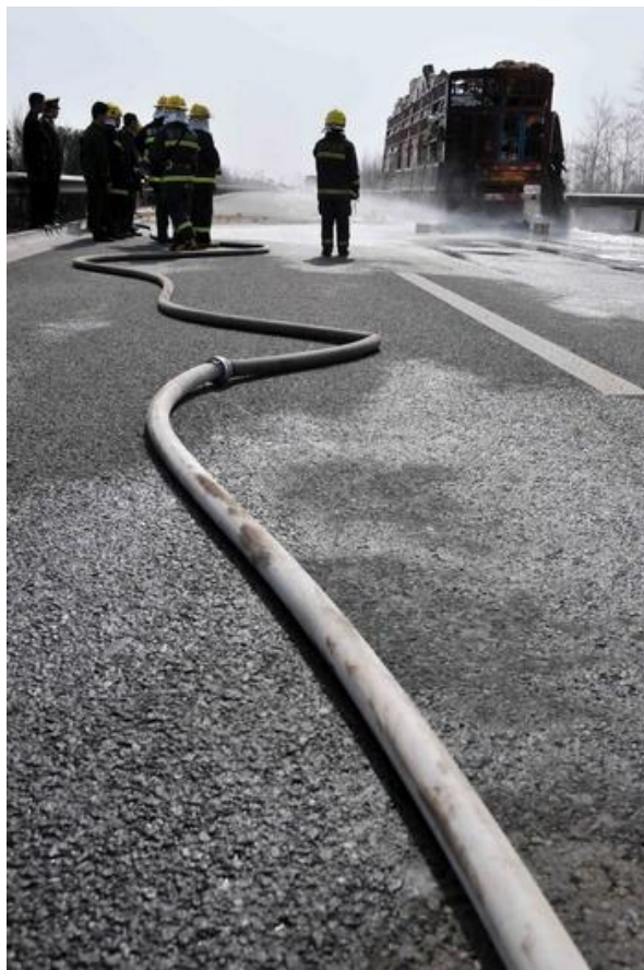
3月26日，消防队员在灭火。